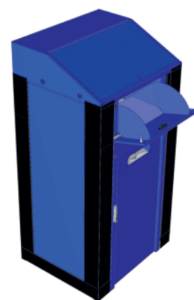
4. moduł do zwrotów gotowy do używania

CYCLEBOX to profesjonalne urządzenie do zwrotu artykułów i produktów wymagających nadzoru. Cały system składa się z urządzenia wydającego - głównego, oraz urządzenia odbierającego - dodatkowego. Urządzeniem głównym może być każdy produkt z gamy dystrybutorów TEMREX .