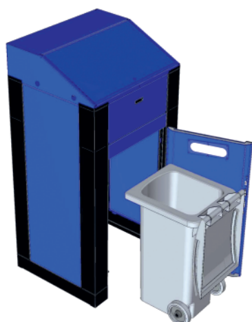
2. umieszczenie kontenera w niszy