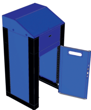
1. otwarcie niszy na kontener