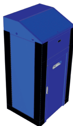
3. zamknięcie niszy na kontener